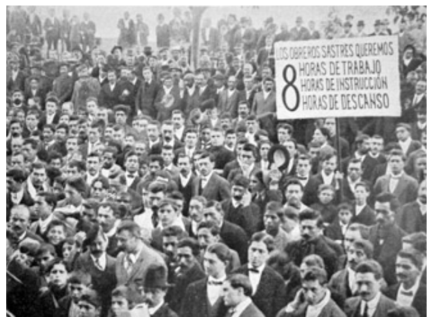
FORA-Demo für 8h-Tag

Seine Schilderung von unterdrückten Streiks und des Aufstand der Arbeiter*schaft im Süden des Landes, welcher 1920-'22 vom argentinischen Militär blutig niedergeschlagen wurde, wurde weltbekannt. Bei diesen Massakern wurden ca. 1.500 Arbeiter*innen hingerichtet, die überwiegend in der anarchistischen Arbeiter*föderation FORA („ Federación Obrera Regional Argentina “) organisiert waren.