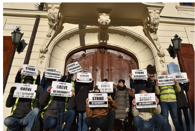
Solidaritätsaktion der PA-IAA für die Gelben Westen vor der Französischen Botschaft in Bratislava/Slowakei