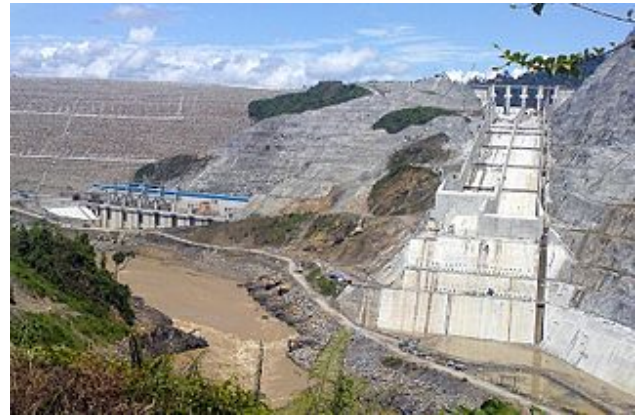
Baustelle des Bakun-Staudamms in Malaysia, 2009

Die restliche Million Dollar wurde ausgegeben für Projekte, wie große Wasserkraft-Staudämme, welche nicht länger als grüne Energie angesehen werden, wegen ihrer schädlichen Auswirkungen auf das Klima durch fortschreitende Entwaldung und Freisetzung von Kohlendioxid und Methan.