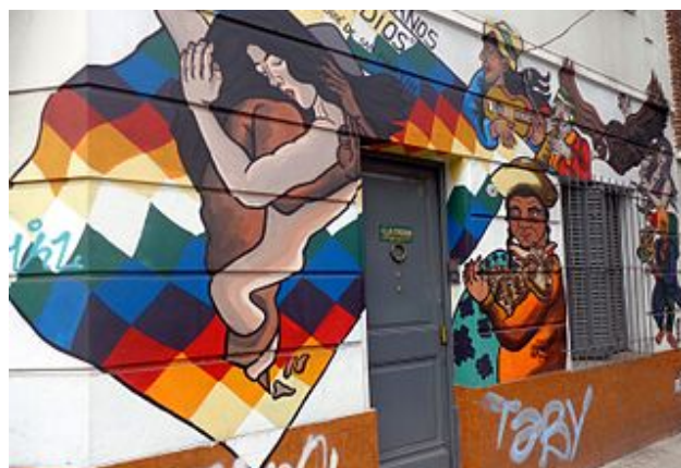
Wandgemälde an O.Bayers Wohnhaus in Buenos Aires

Dafür war er 2007 von den „ Müttern der Plaza de Mayo “, die weiterhin um das Andenken der „Verschwundenen“ kämpfen und auch ein Literaturcafé nach ihm benannt haben, mit einem Preis ausgezeichnet, der ihm mehr bedeutete als seine sieben Ehrendoktorwürden.